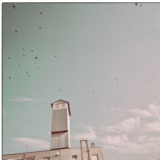
HORST MARKA | Am Hafen | 90 x 90 cm

Die BLAU-GELBE-GALERIE ST. PETER IN DER AU und die Marktgemeinde St. Peter in der Au laden zur Eröffnung und zum Besuch der Ausstellung ein.