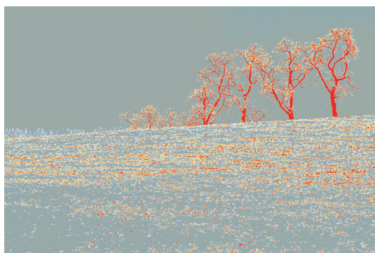
PETER LAGLER | Wintertraum | 40 x 60 cm